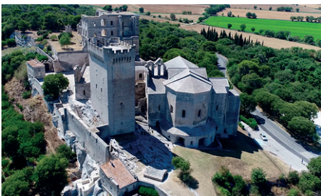
L'abbaye bénédictine de Montmajour

Jusqu'à quelle époque la chapelle a-t-elle dépendu de Montmajour? C'est au XVI e siècle que le domaine devient privé et que la chapelle, d'abord dédiée à Saint Pierre, est consacrée à sainte Marie-Madeleine, la grande pécheresse