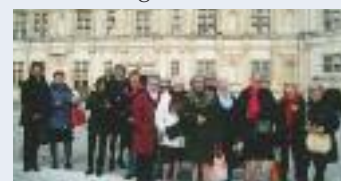
Sortie "Journée de la Femme" à GRIGNAN, le 8 mars 2017

Contact : Yvette FARAVEL, présidente 06 74 41 91 14 - faravelmichel@orange.fr