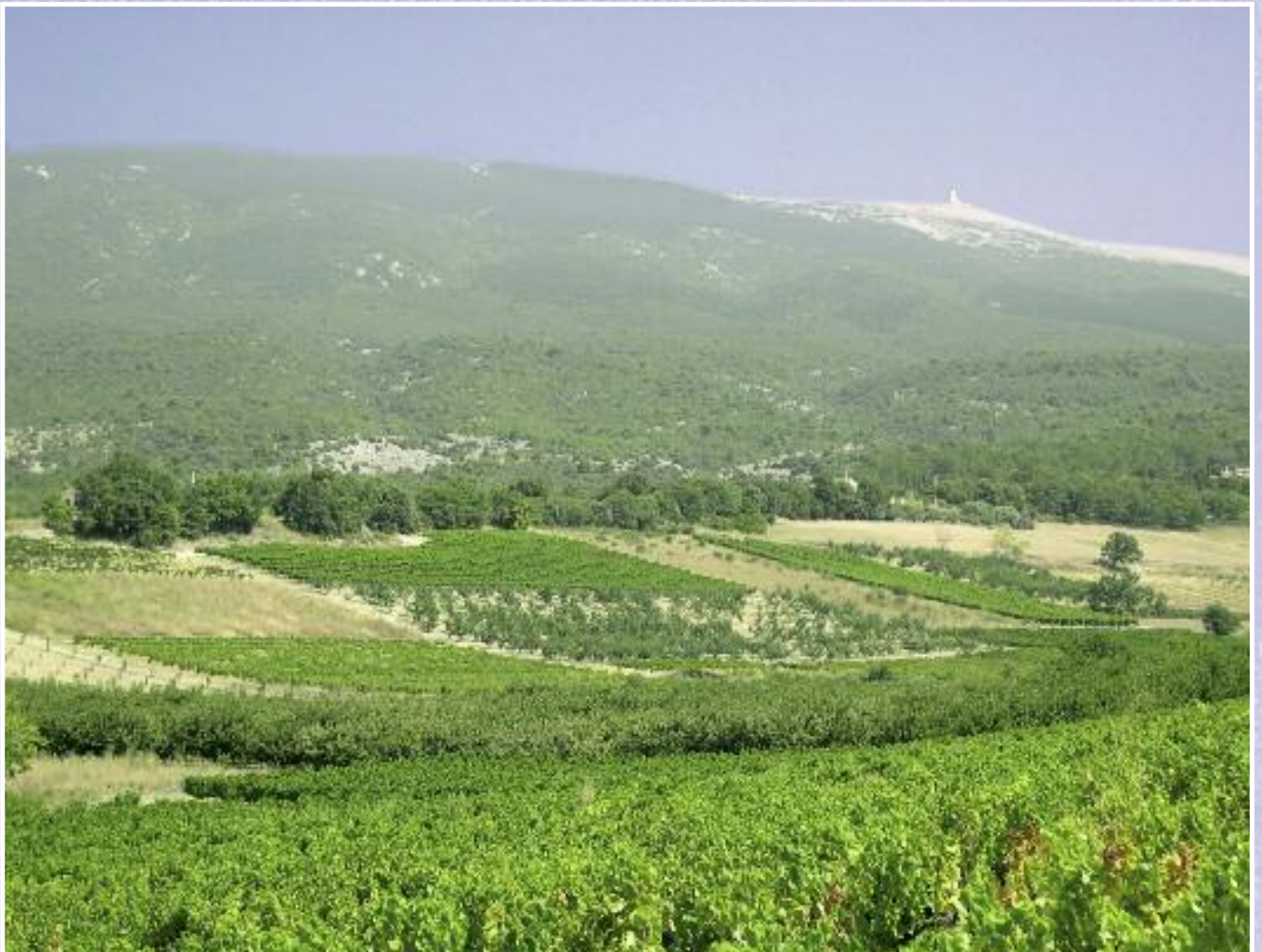
Vignes et Ventoux, le vallon les Baux