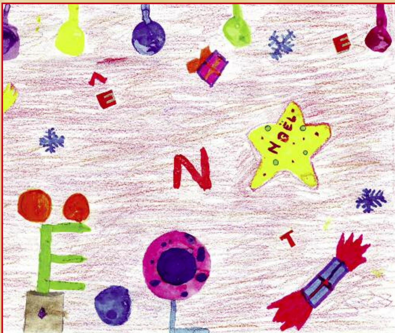
Classe de CM2 - Dessin de Carla