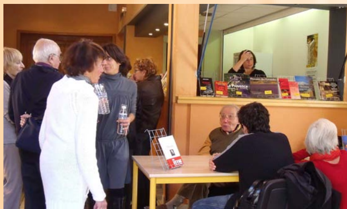
Salon du livre