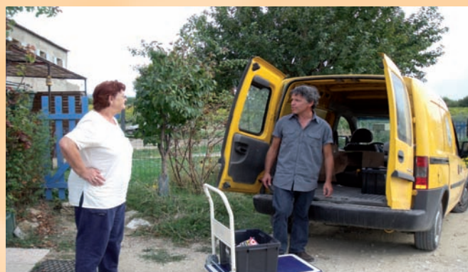
Portage de livres à domicile

- Les rencontres du Club de lecture sont prévues les mercredi 6 janvier, 10 février et 10 mars à 18 h salle du Conte lu.