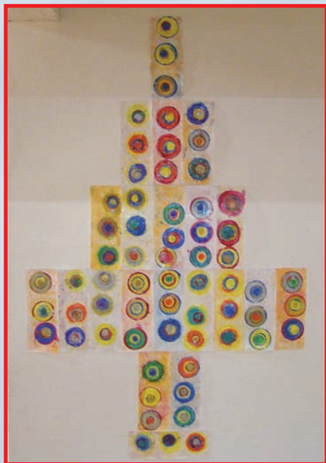
Décor réalisé par les enfants de l'école maternelle

Un apéritif offert par la municipalité de Flassan nous a ensuite réunis pour le verre de l'amitié. La journée s'est poursuivie à la salle des fêtes de Flassan par notre banquet annuel qui s'est terminé tard le soir au son de l'accordéon.