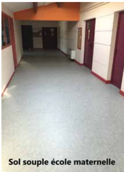
Sol souple école maternelle

Un bon nombre de travaux ont été réalisés en régie (plomberie, peinture, travaux sur toiture et différents aménagements) afin de garantir une meilleure qualité d'accueil pour nos enfants et enseignants.