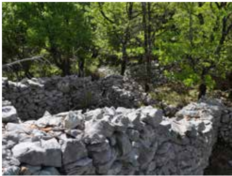
Jas du Compagnon haut