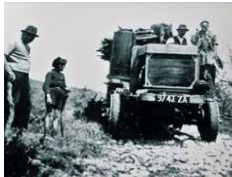
Nash-Quad de 1917