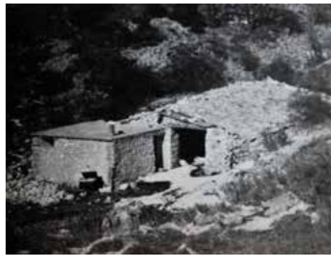
Jas du Toumple