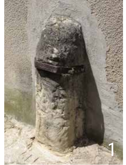
Chasse roue cerclé de fer