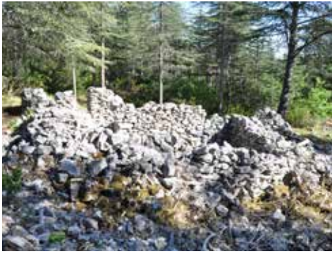
Jas de Gloire