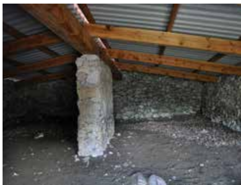
Jas du Toumple