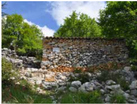
Jas du Compagnon bas