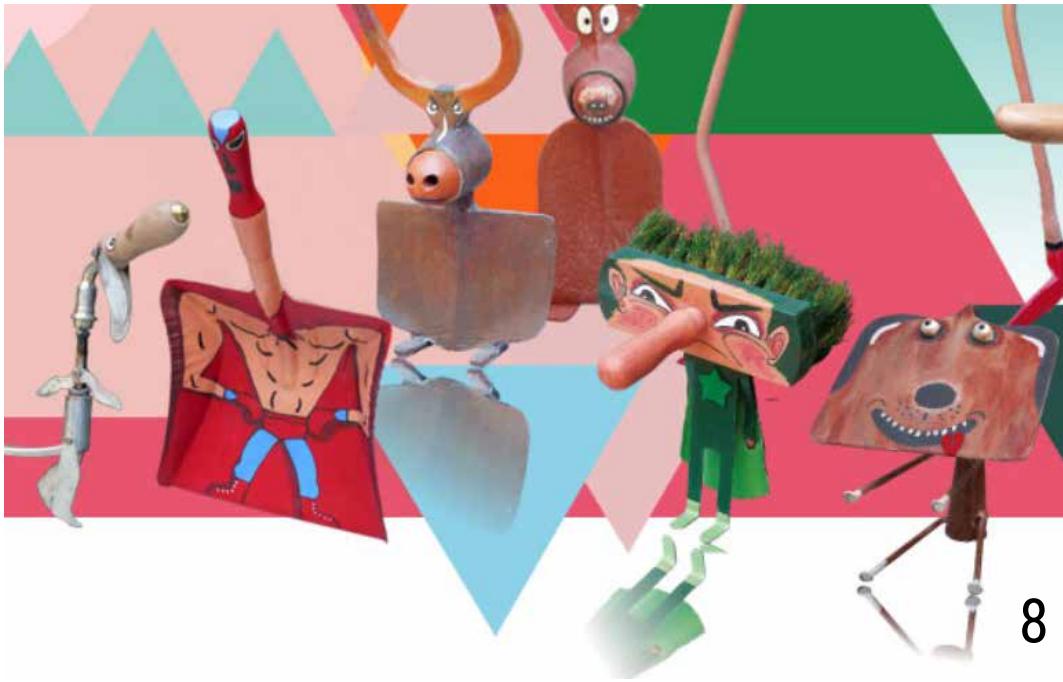
Le grand show des petites choses