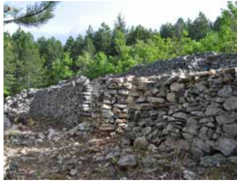
Jas de Guigau