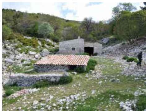
Jas du Toumple