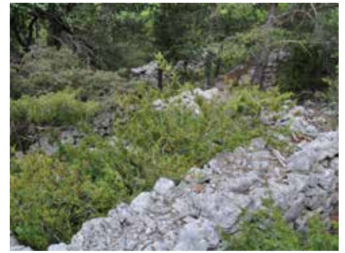
Jas de Gerbaud