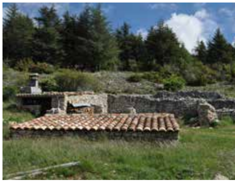
Jas de la Couanche