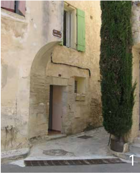
Trompe réalisée par des Compagnons du Tour de France