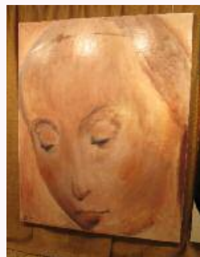
La Madone - Marquès, 2015

Plusieurs de ses œuvres sont également présentes dans les communes de Piolenc, Puymeras et Courthézon, auxquelles il en a fait don, ainsi qu'à la cathédrale de Vaison-La-Romaine.